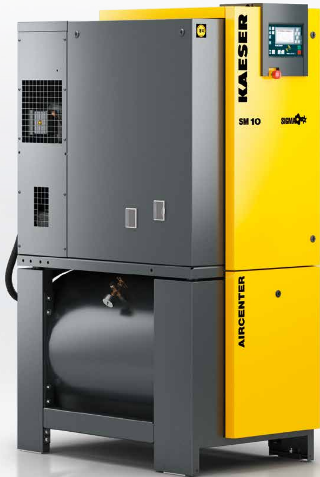
Imagen: AIRCENTER SM 10