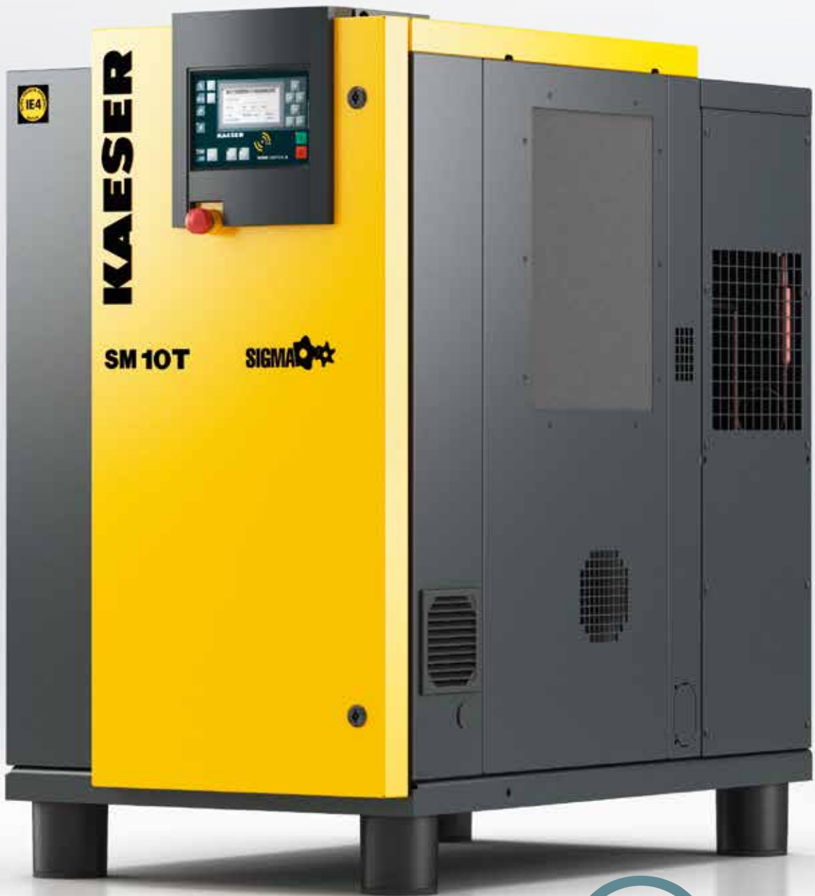
Imagen: SM 10 T

Todos los servicios de mantenimiento pueden llevarse a cabo por un solo lado. Para ello, el panel izquierdo del gabinete es desmontable, y desde allí es sencillo acceder a todos los puntos de mantenimiento.