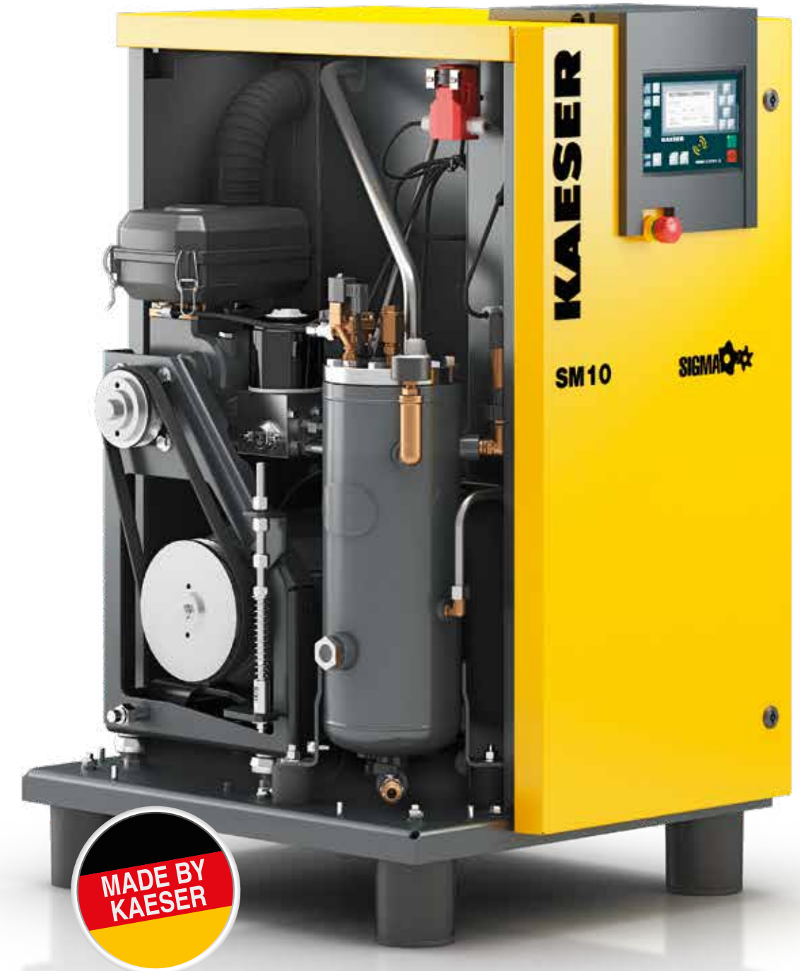
Imagen: SM 10

Hasta 96 % aprovechable en forma de calor